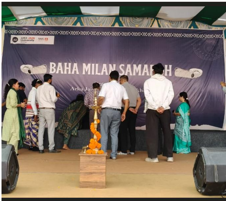
Fig. 2- Tribute to Swami Vivekanand Ji and Shri Birsa Munda Ji