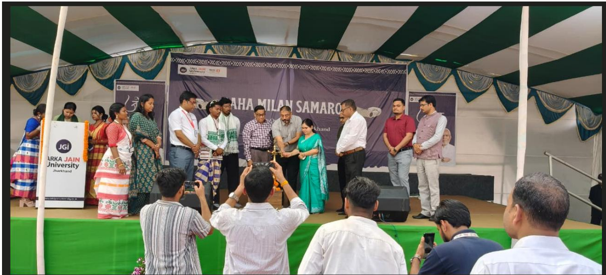
Fig.1- Lamp Lighting Ceremony.