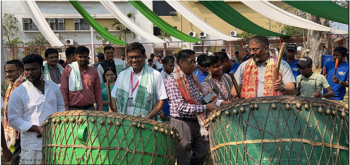
Fig. 9- Dignitaries, Faculty and students together enjoying cultural dance and Thumak Dhol