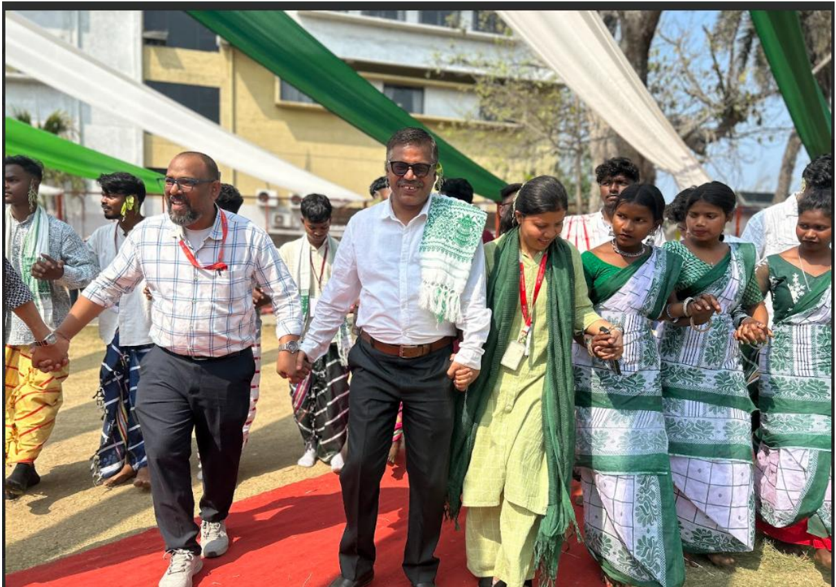
Fig. 10- Dignitaries, Faculty and students together enjoying cultural dance and Thumak Dhol