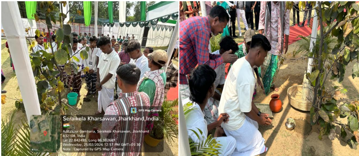
Fig. 6- Traditional puja at Jahar Sathal by Priest