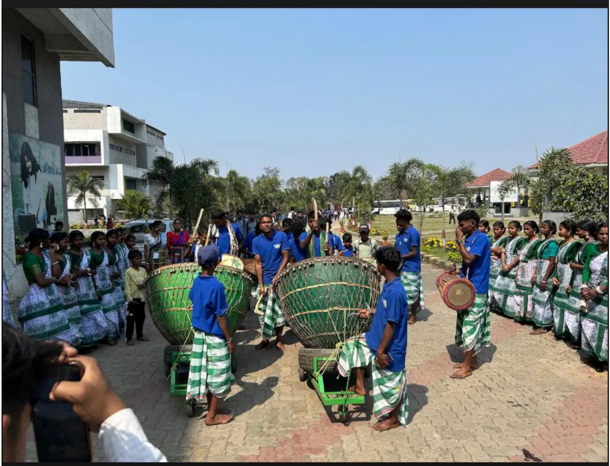
Fig. 3- Beginning of the event with Thumak Dhol