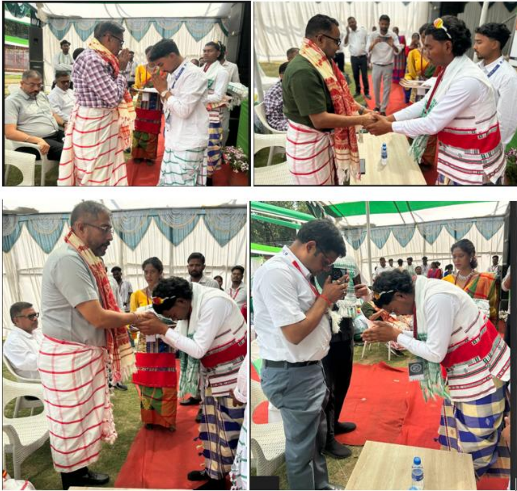
Fig. 5- Felicitation by students with tradition poshak