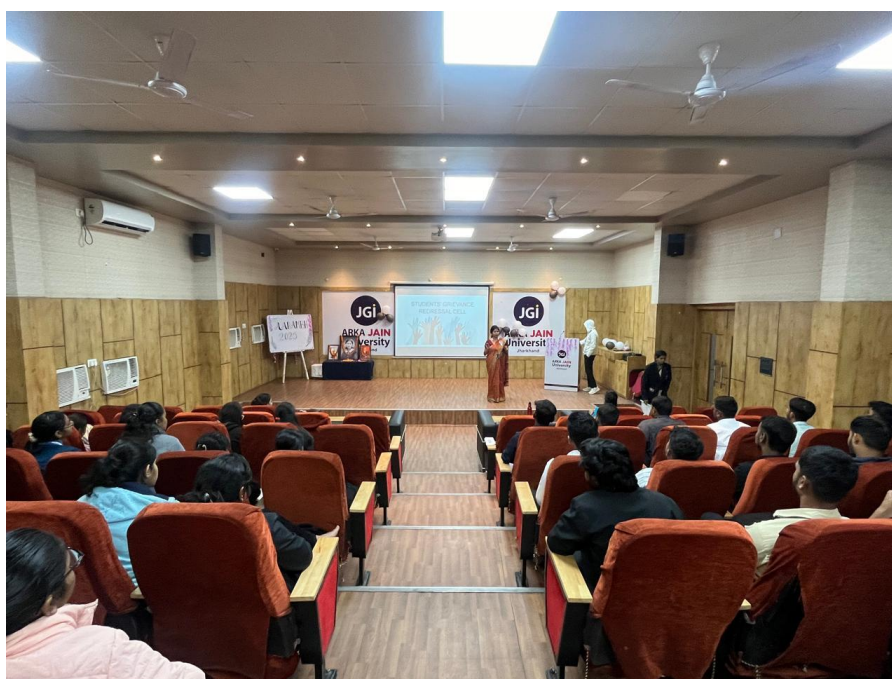
Fig. 2-Explaining about the grievance to newly inducted students of B.Sc. Nursing 2025-29