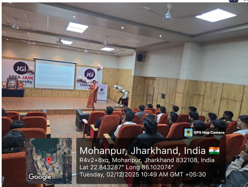
Fig. 3-Session taken by Mrs.Subhashree Rout on Grievance Handling procedure.