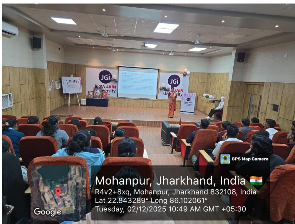
Fig. 5- Explaining about the grievance to newly inducted students of B.Sc. Nursing 2025-29