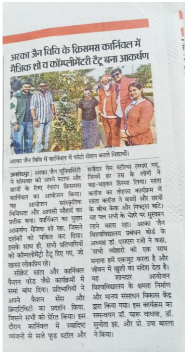
अरका जैन विवि में कार्निवल में फोटो सेशन करते विद्यार्थी।

जमशेदपुर। अरका जैन यूनिवर्सिटी ने सोमवार को अपने स्टाफ और छात्रों के लिए रंगारंग क्रिसमस कार्निवल का आयोजन किया। यह आयोजन सांस्कृतिक विविधता और आपसी सौहार्द का प्रतीक बना। कार्निवल का मुख्य आकर्षण मैजिक शो रहा, जिसने दर्शकों को चकित कर दिया। इसके साथ ही, सभी प्रतिभागियों को कॉम्प्लीमेंटरी टैटू दिए गए, जो खासा लोकप्रिय रहे। सीक्रेट सांता और कार्निवल फैशन परेड जैसे कार्यक्रमों में सभी बांध दिया। प्रतिभागियों ने अपने फैशन सेंस और क्रिएटिविटी का प्रदर्शन किया, जिसने सभी को प्रेरित किया। इस दौरान कार्निवल में स्वादिष्ट व्यंजनों से सजे फूड स्टॉल और