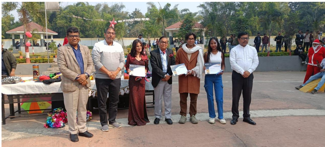
Winners of Fashion show Christmas carnival