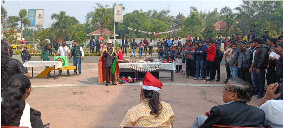
Magic Show near Nesscafe Area