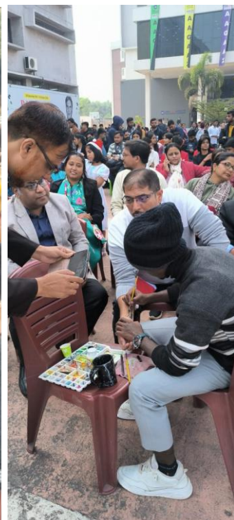
Cake cutting with Santa and tattoo artist making tattoos on Faculty's & Student's hand