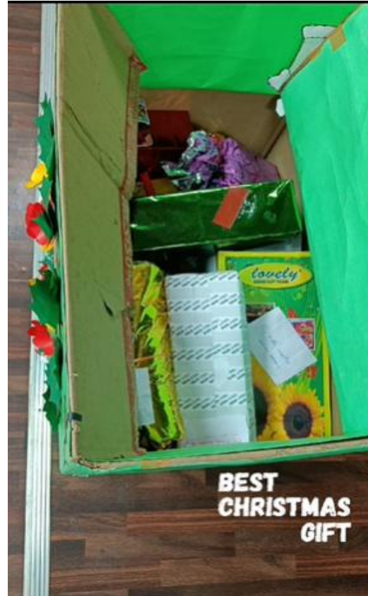
Secret Santa Gift Box