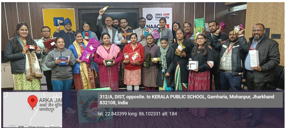
Faculties and staff with their Gift