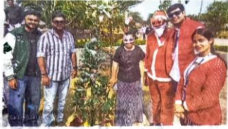
अरका जैन विवि में कार्निवल में फोटो सेशन करते विद्यार्थी।

जमशेदपुर। अरका जैन यूनिवर्सिटी ने सोमवार को अपने स्टाफ और छात्रों के लिए रंगारंग क्रिसमस कार्निवल का आयोजन किया। यह आयोजन सांस्कृतिक विविधता और आपसी सौहार्द का प्रतीक बना। कार्निवल का मुख्य आकर्षण मैजिक शो रहा, जिसने दर्शकों को चकित कर दिया। इसके साथ ही, सभी प्रतिभागियों को कॉम्प्लीमेंटरी टैटू दिए गए, जो खासा लोकप्रिय रहे। सीक्रेट सांता और कार्निवल फैशन परेड जैसे कार्यक्रमों में सभी बांध दिया। प्रतिभागियों ने अपने फैशन सेंस और क्रिएटिविटी का प्रदर्शन किया, जिसने सभी को प्रेरित किया। इस दौरान कार्निवल में स्वादिष्ट व्यंजनों से सजे फूड स्टॉल और