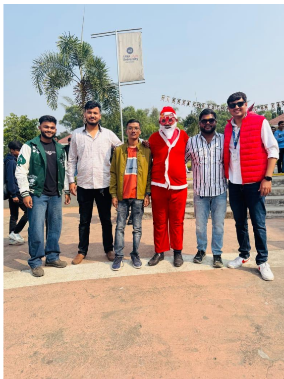
Christmas Day celebration by Christmas tree Decoration