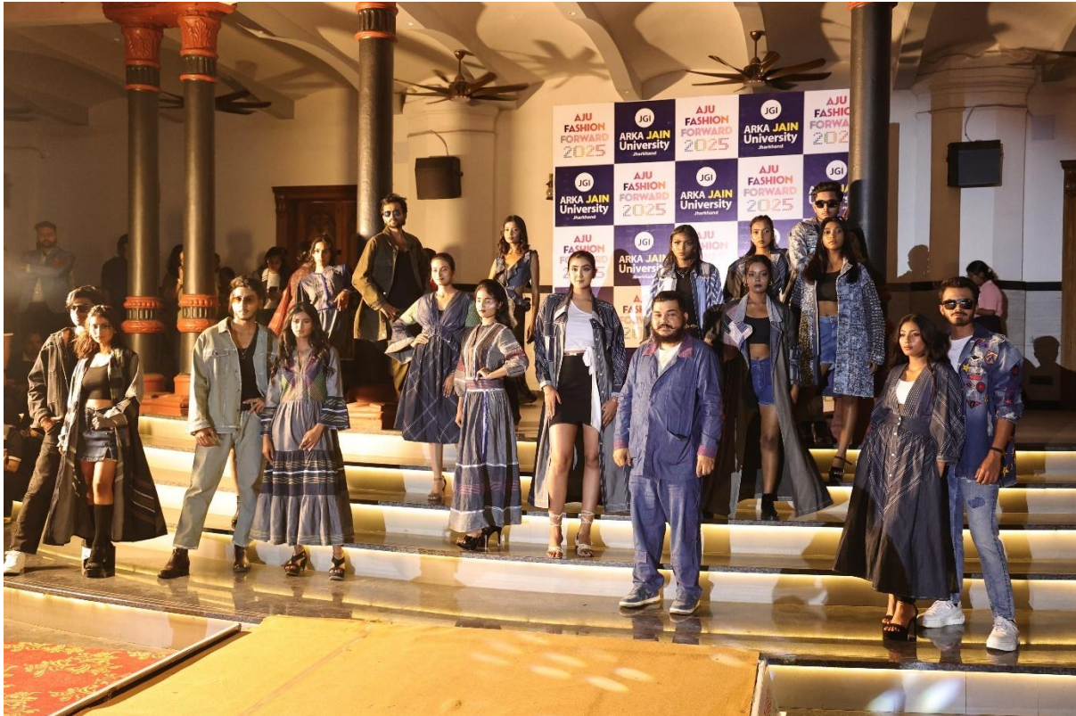
Fig. 5- Project Redenim from the Lakme Fashion Week Designer