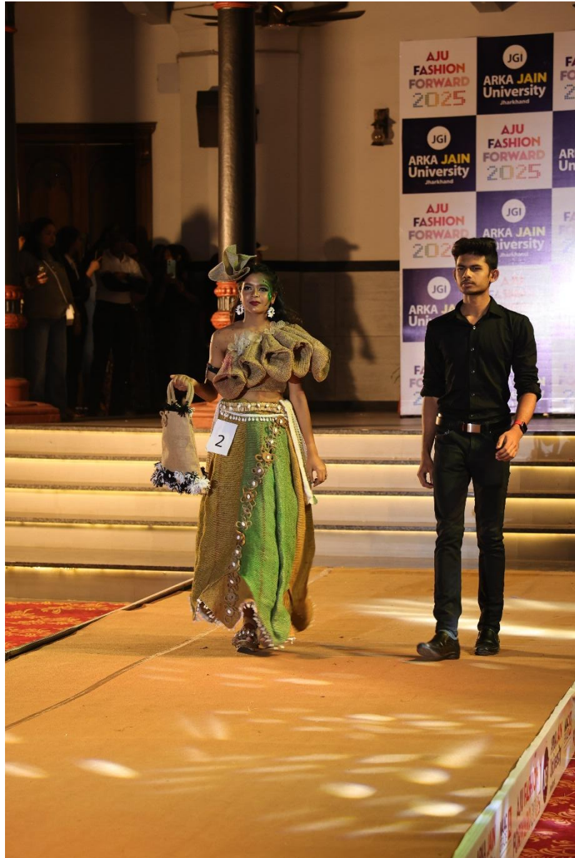
Fig. 14 – Design aspirants from school – Sustainable Design Competition