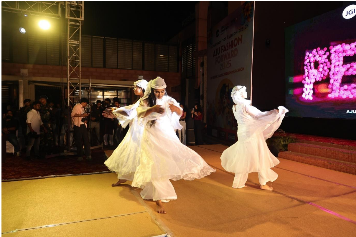
Fig. 9- Welcome Dance – Kandisa