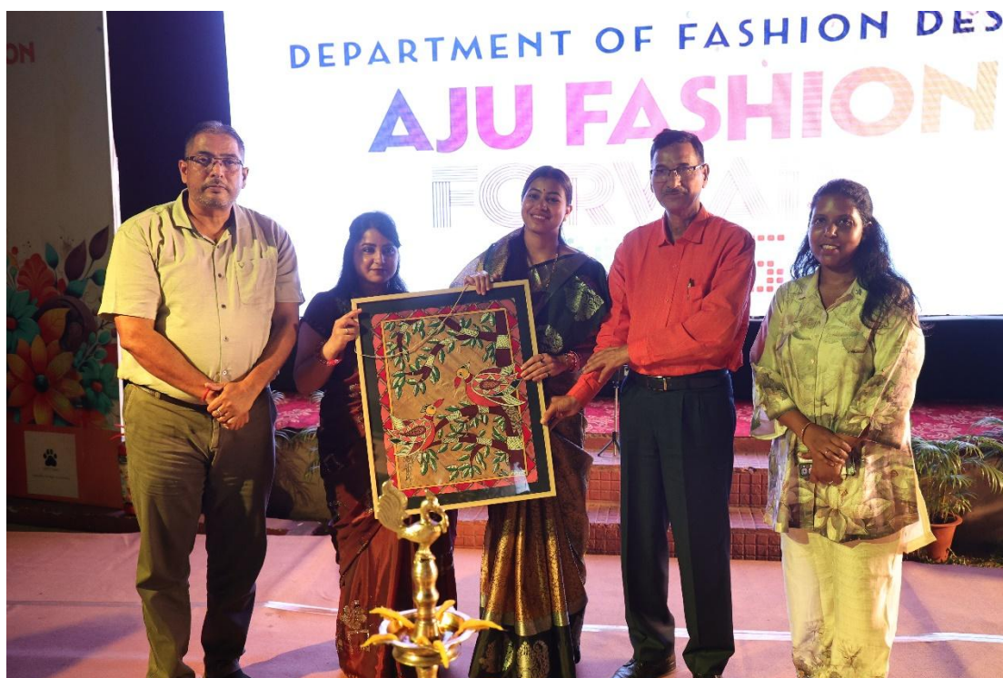
Fig. 2- Presenting the Guest with Madhubani Painting