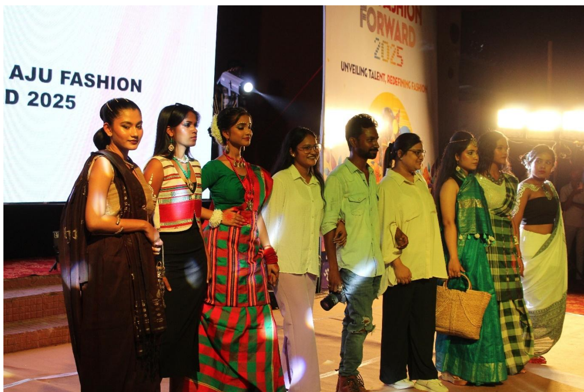
Fig. 4- Alumni Collection X Kalamandir Saksham SHG Federation – Tribes of Jharkhand