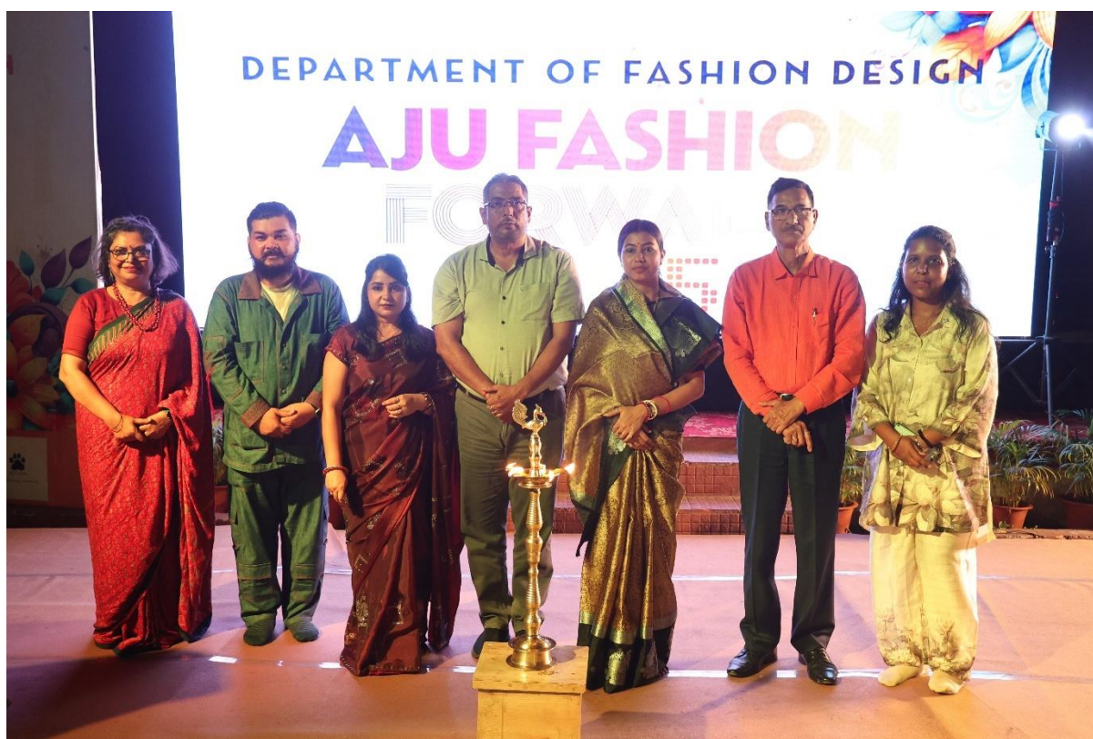
Fig.1- Lamp Lighting Ceremony