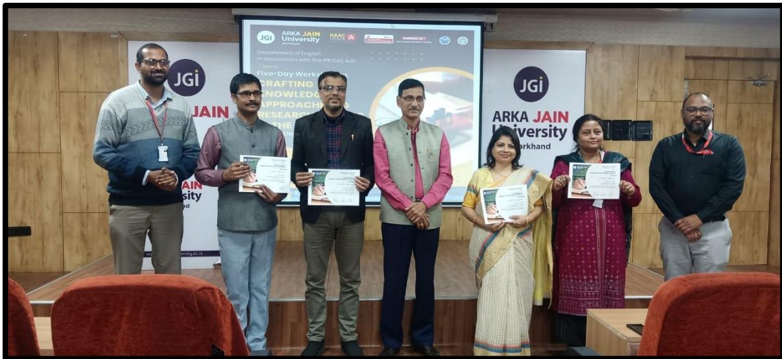
Fig. 18- Resource Persons awarded with Certificate by the DSW in the Valedictory Session