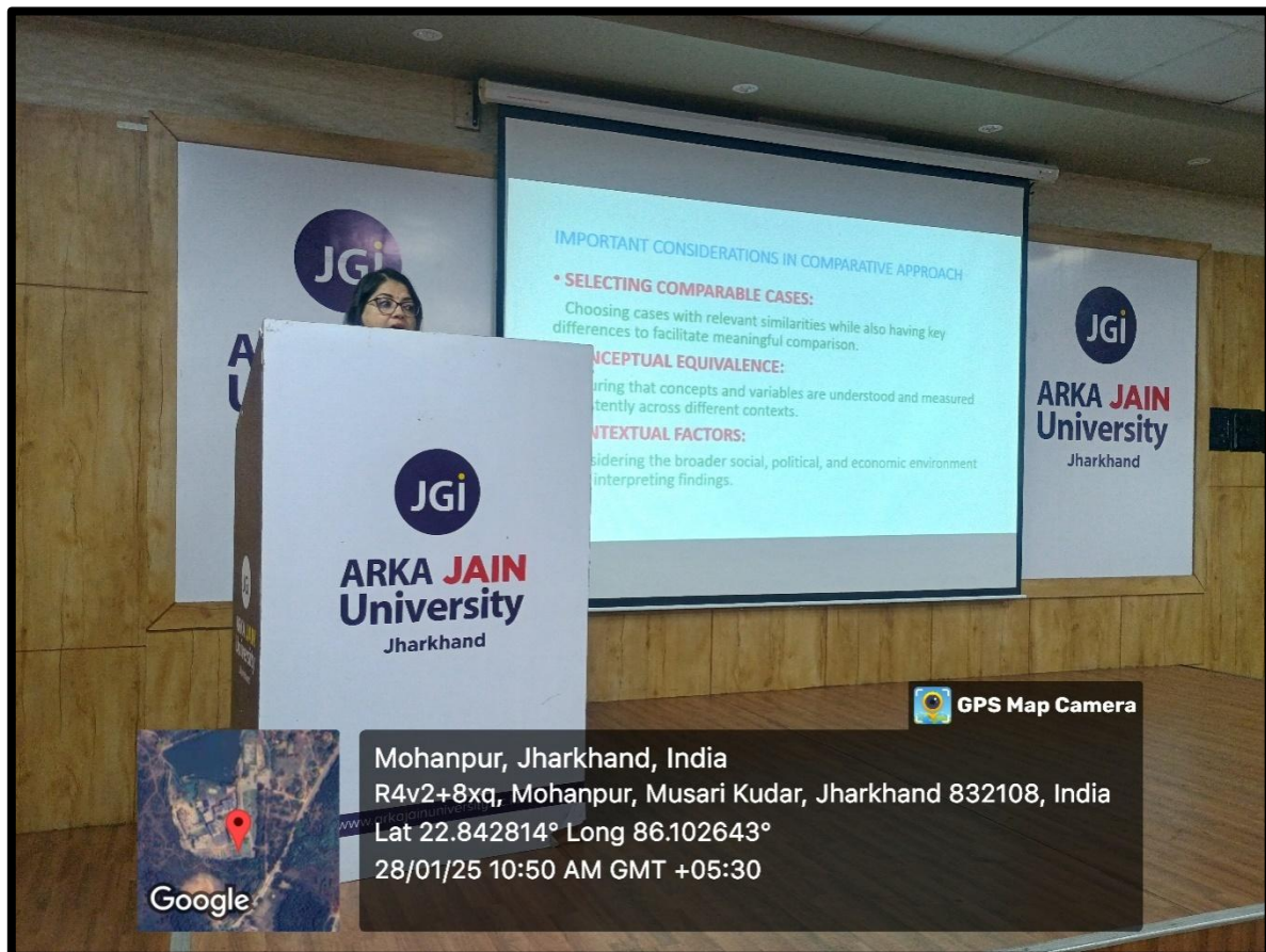
Fig. 8- Resource Person of Day 2 Dr. Rajkumari Ghosh delivering on 'Research Design and Approaches'