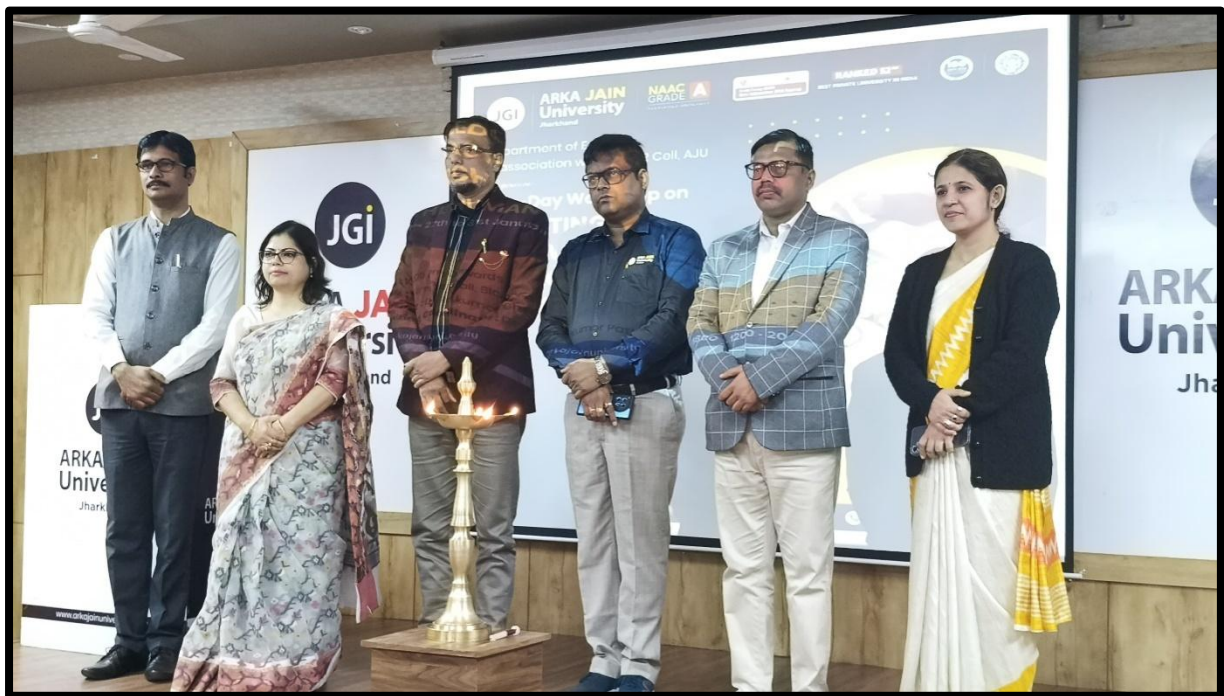
Fig.2- Inaugural Lamp Lighting Ceremony