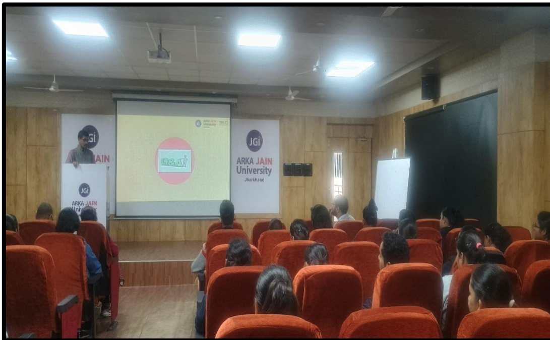
Fig. 15- Q&A Session on the 5 th Day of the Workshop