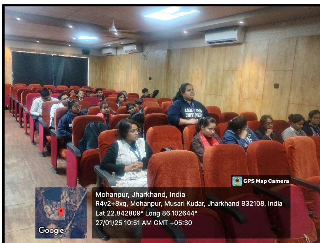
Fig. 6- A participant posing a question to the resource person during the workshop