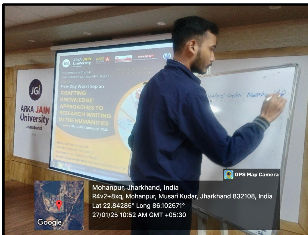
Fig. 7- A participant writing reference in MLA style during the workshop