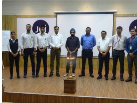
“इक टू इमैक्ट” विषय के माध्यम से बस्ताओ ने पत्रकारिता के विद्यार्थियों को बस्ता और फिल्ट ट्रेनिंग के महत्व को बताया

Campus Boom - Educational News | Save it Last updated: 2024/11/05 at 10:18 AM | 3 Min Read