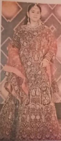
बेल्टीह क्लब में फैशन फारवर्ड शो के दौरान रैंप वाक पर उतरीं विद्यार्थी।