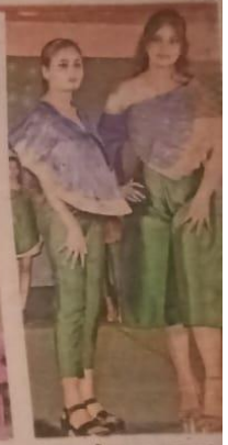
रैंप पर उतरीं माडल्स • जागत्य