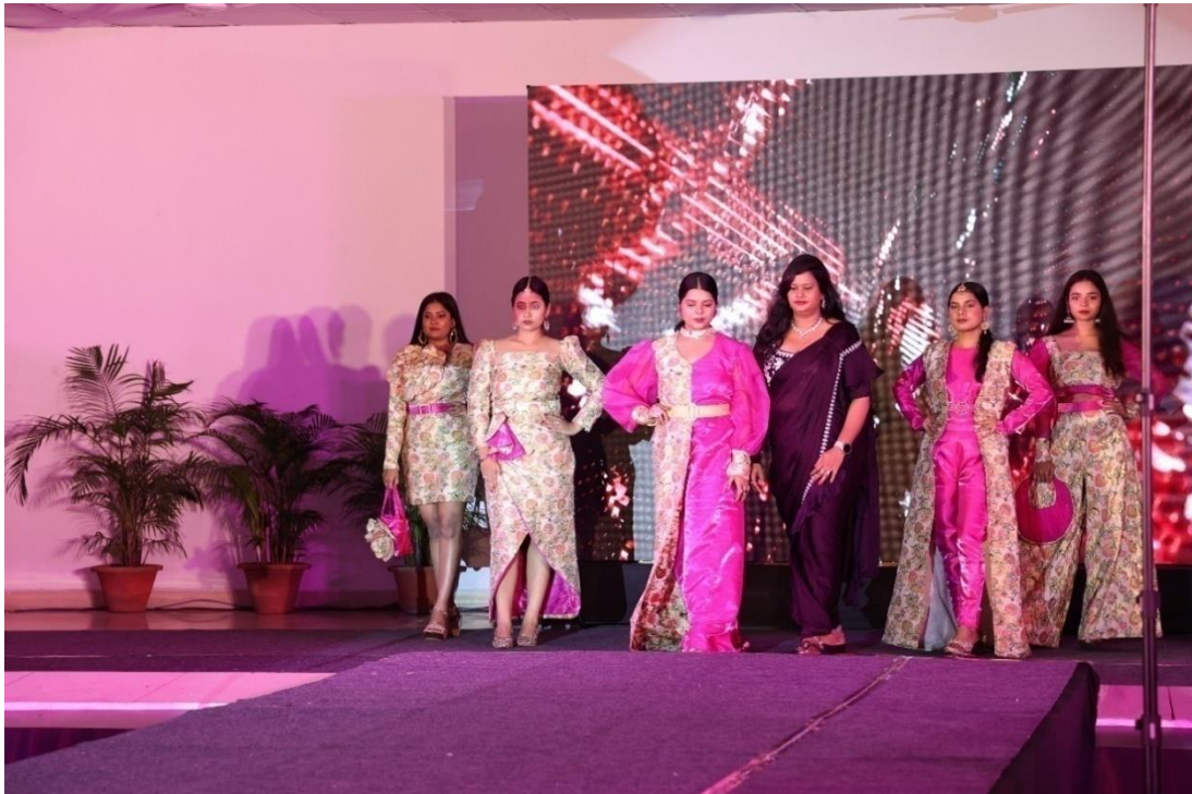
Collection – Desi Diversity