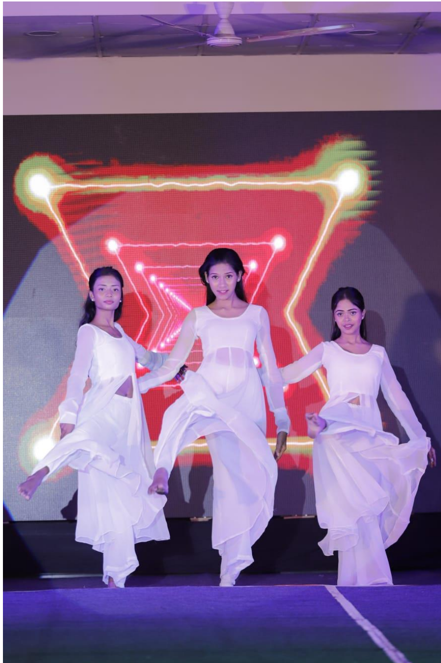
Welcome Dance - Kandisa