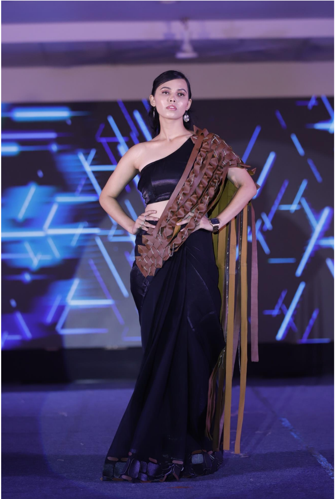
Rexin Saree – Departmental Garment