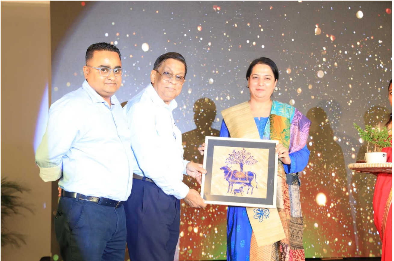
Guest Felicitation – Handmade Kamdhenu on water hyacinth paper