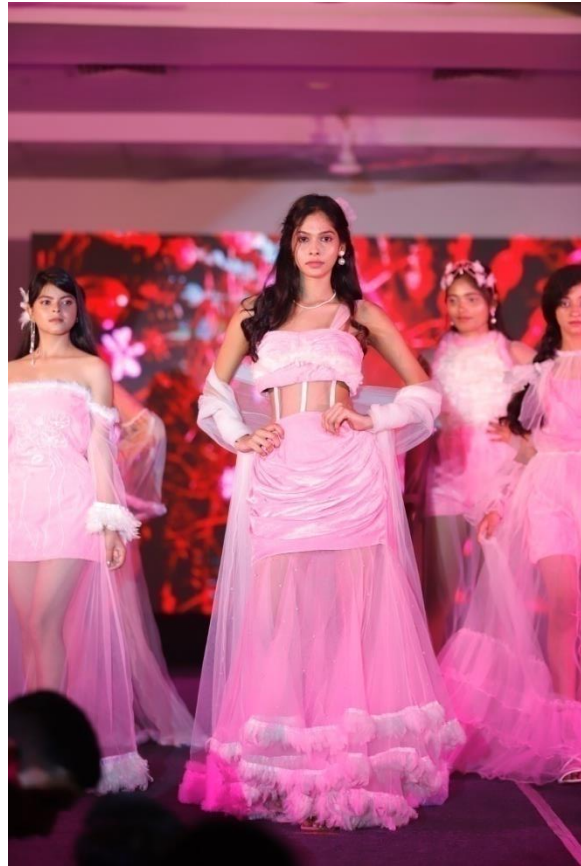
Collection – Diaphanous Elegance ‘Soft Girl’