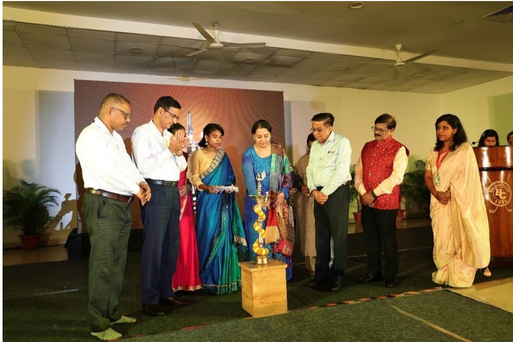
Lamp lighting Ceremony