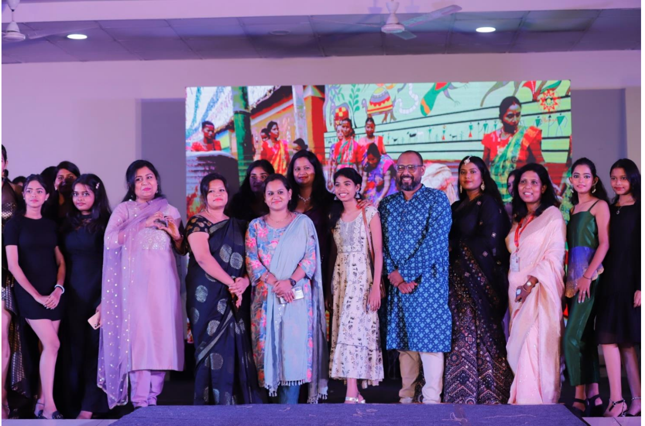
Department of Fashion Design