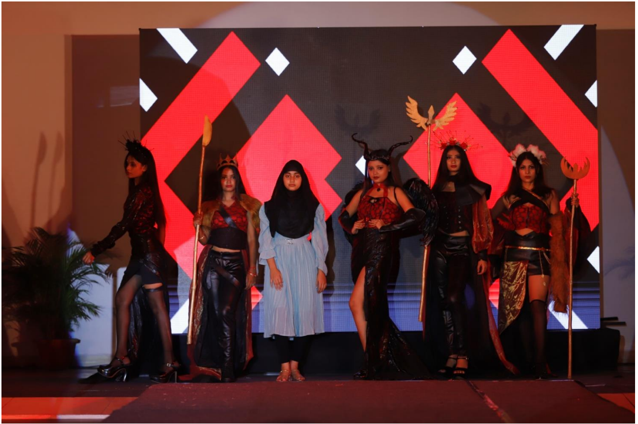
Collection - Gaming