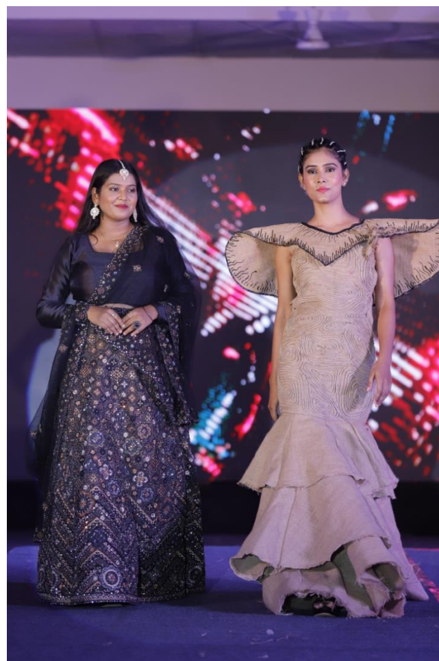
Collection – Sustainable Fashion