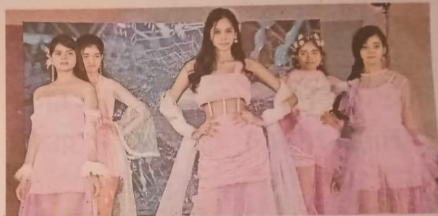
बेल्टीह क्लब में रैंप पर वाक करतीं माडल्स व अर्का जैन विश्वविद्यालय की फैशन डिजाइन विभाग की छात्राएं • जागत्य