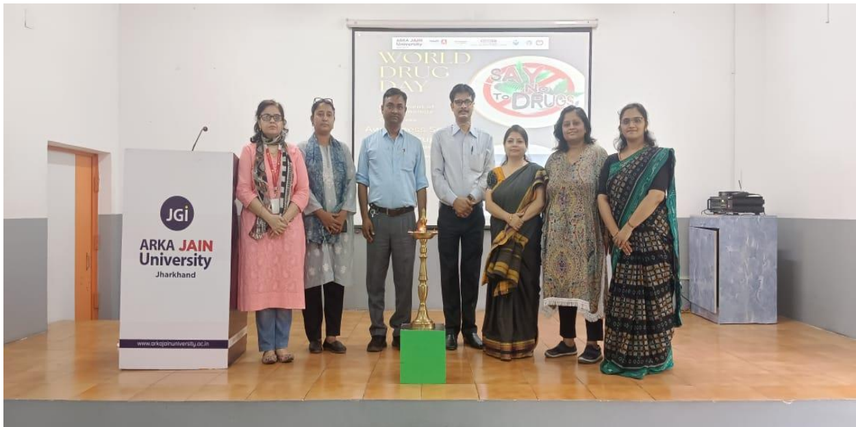
Department of Biotechnology and Department of English observed the World Drug Day