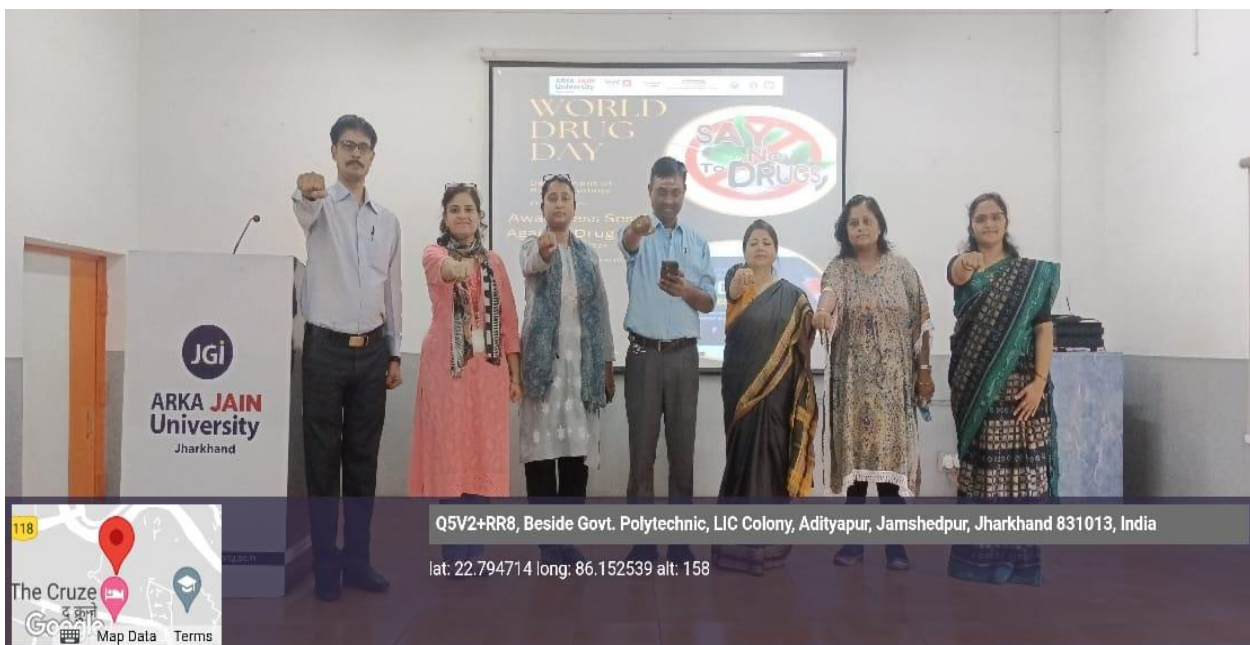
Faculties took pledge for creating awareness and prevention for Drug addiction and abuse