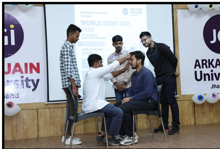
Students presenting a skit on eye disorders caused as occupational hazard and counter measures for the same.