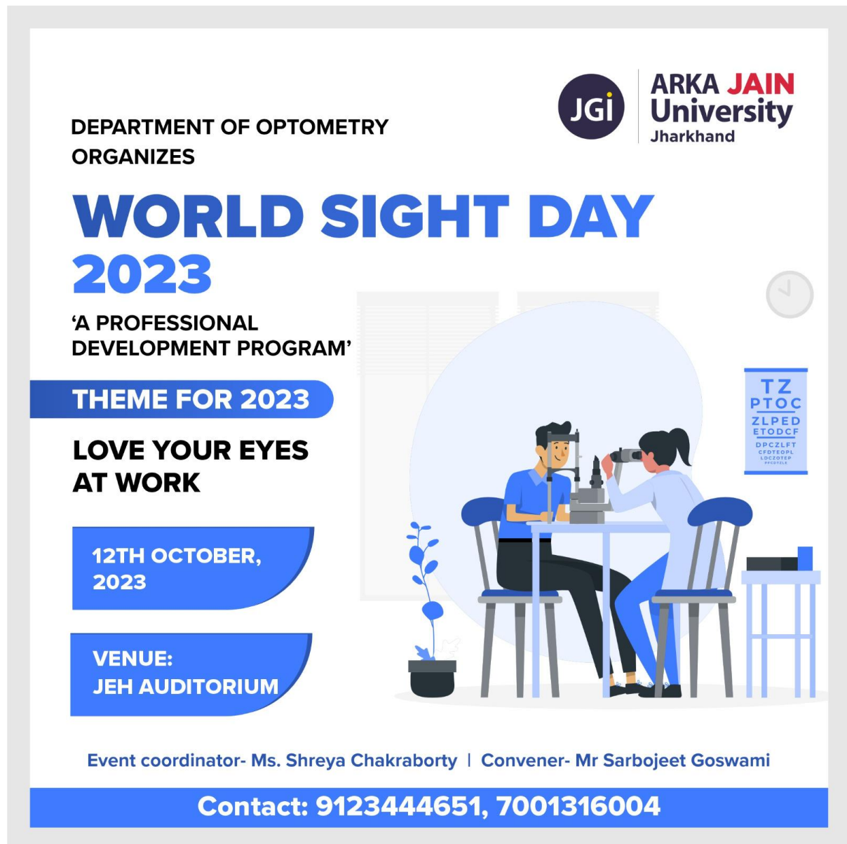
Poster of the Event: World Sight Day 2023- Love your eyes at Work