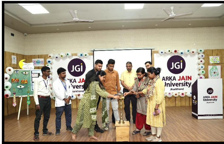
Dignitaries lighting the lamp on the dais