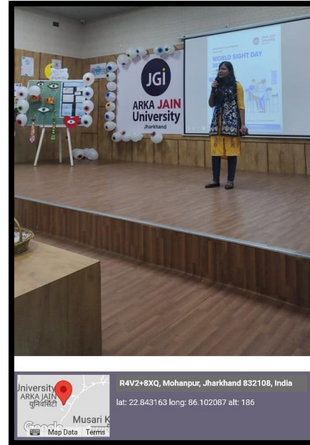
A student singing the Ganesh Vandana