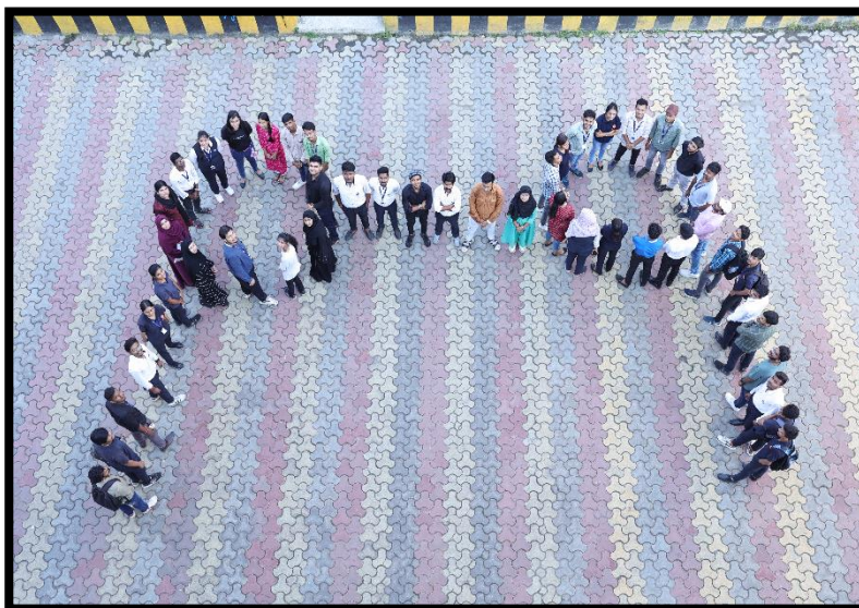
Glasses- a symbolism for getting eyes checked in regular intervals of time.