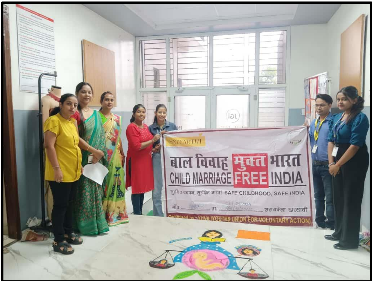
Figure 2: Group Photo of 'SHAKT: The Celebration of Women Power'