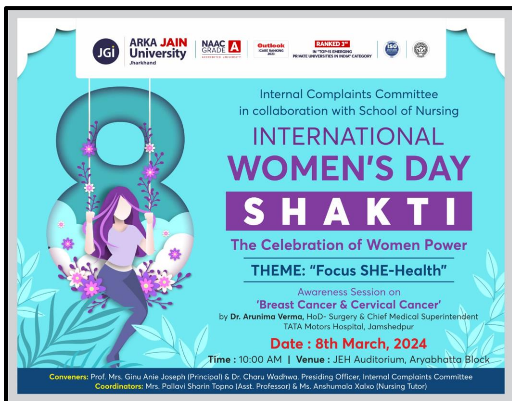
Figure 1: Poster of 'SHAKT: The Celebration of Women Power'