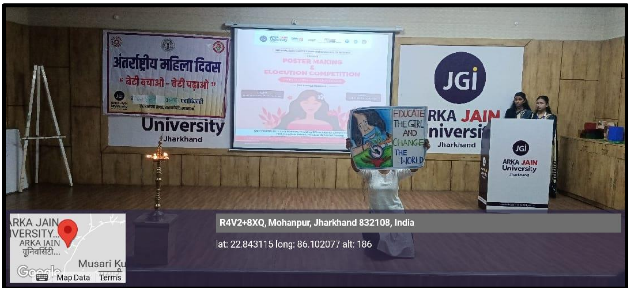
Figure 5: Photo of Play during 'SHAKT: The Celebration of Women Power'