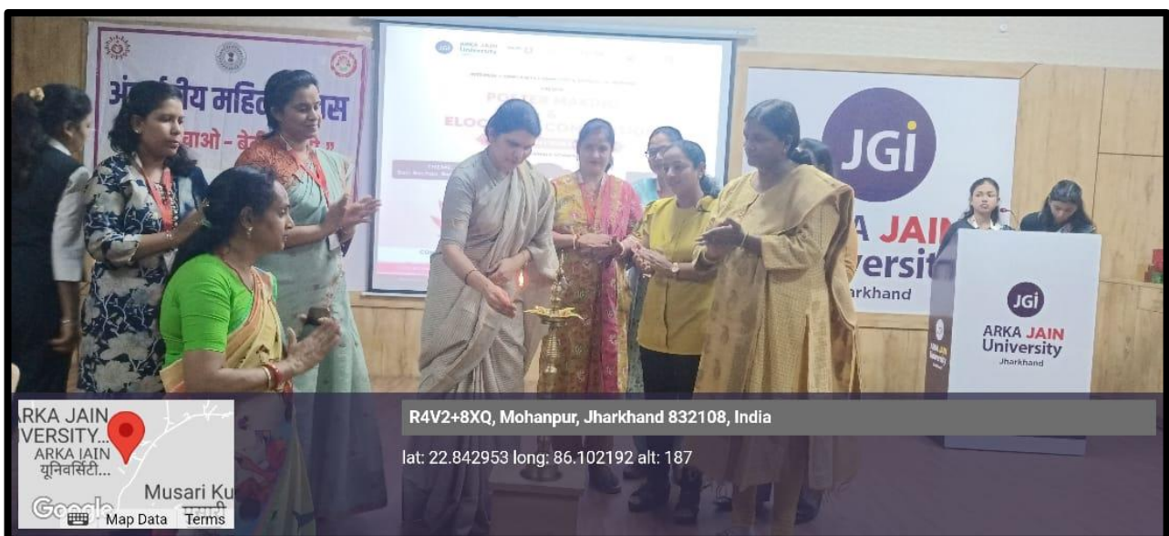
Figure 6: Photo of Lamp lighting during 'SHAKT: The Celebration of Women Power'