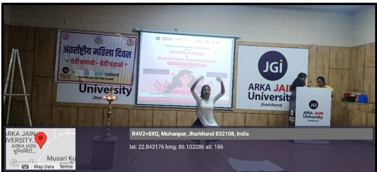
Figure 4: Photo of Dance during 'SHAKT: The Celebration of Women Power'