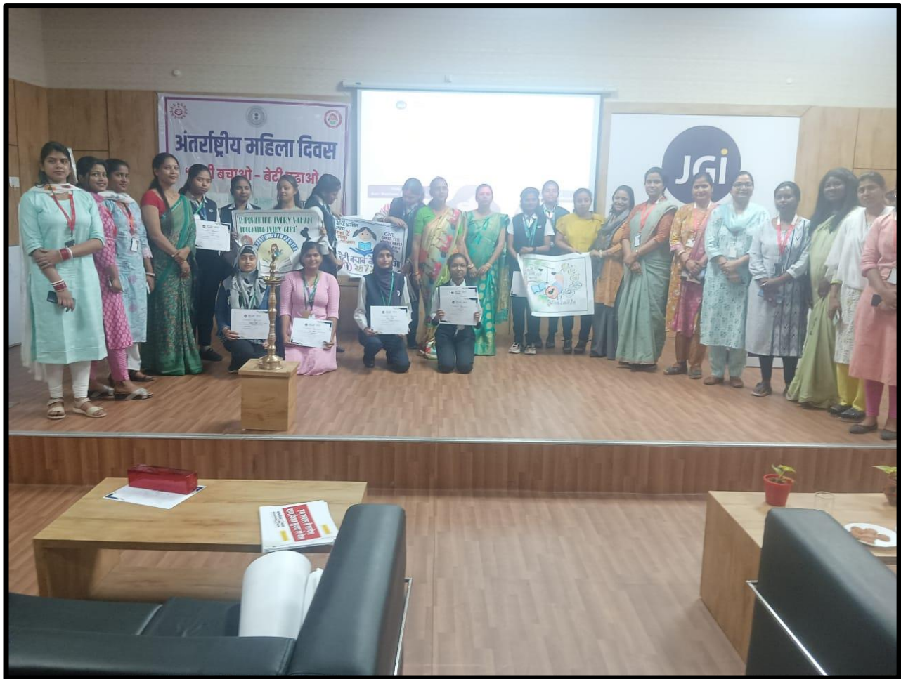
Figure 3: Group Photo of 'SHAKT: The Celebration of Women Power'