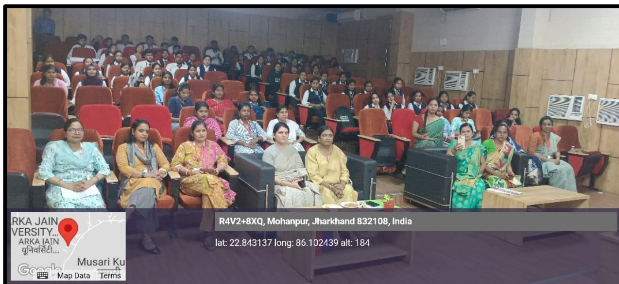
Figure 7: Photo of audience during ‘SHAKT: The Celebration of Women Power’