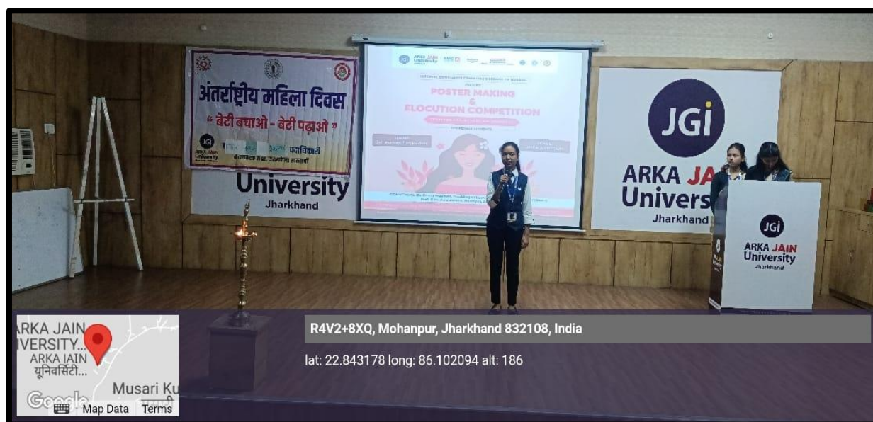
Figure 2: Participant of Elocution Competition delivering speech on Beti Bachao, Beti Padhao