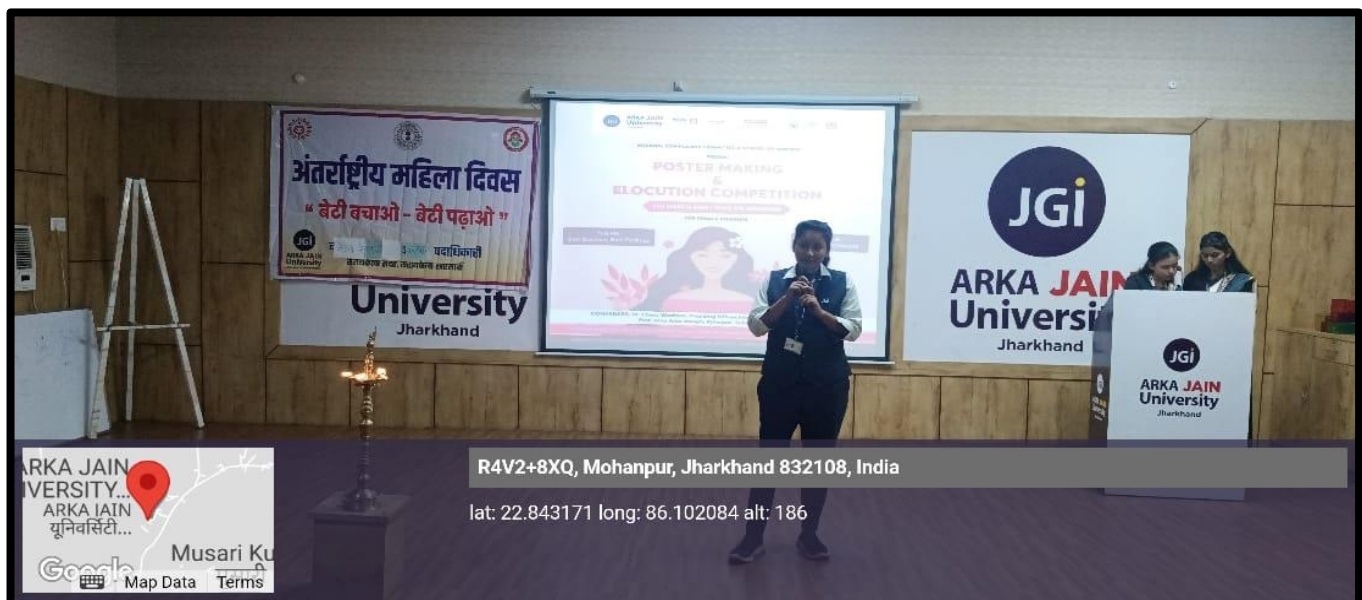
Figure 5: Participant of Elocution Competition delivering speech on Beti Bachao, Beti Padhao