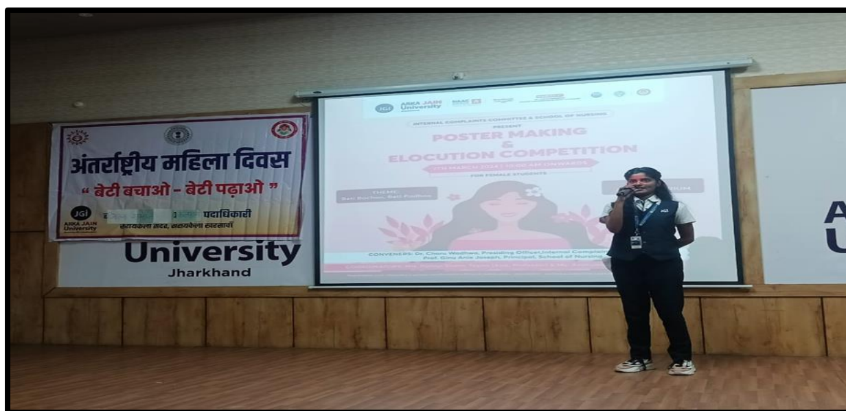
Figure 3: Participant of Elocution Competition delivering speech on Beti Bachao, Beti Padhao