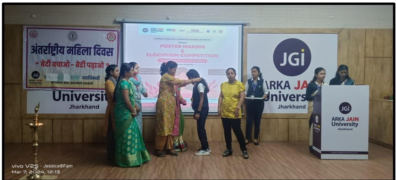
Figure 7: Winners are receiving Prizes of Elocution Competition