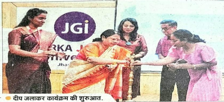
दीप जलाकर कार्यक्रम की शुरुआत.