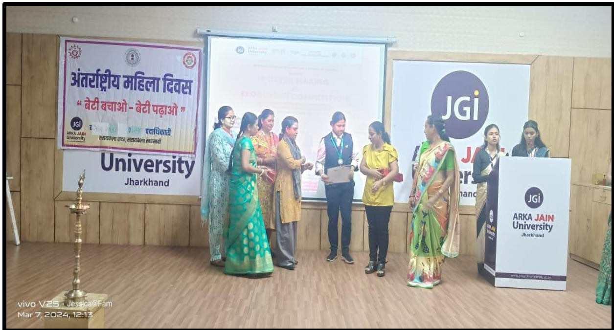
Figure 6: Winners are receiving Prizes of Elocution Competition