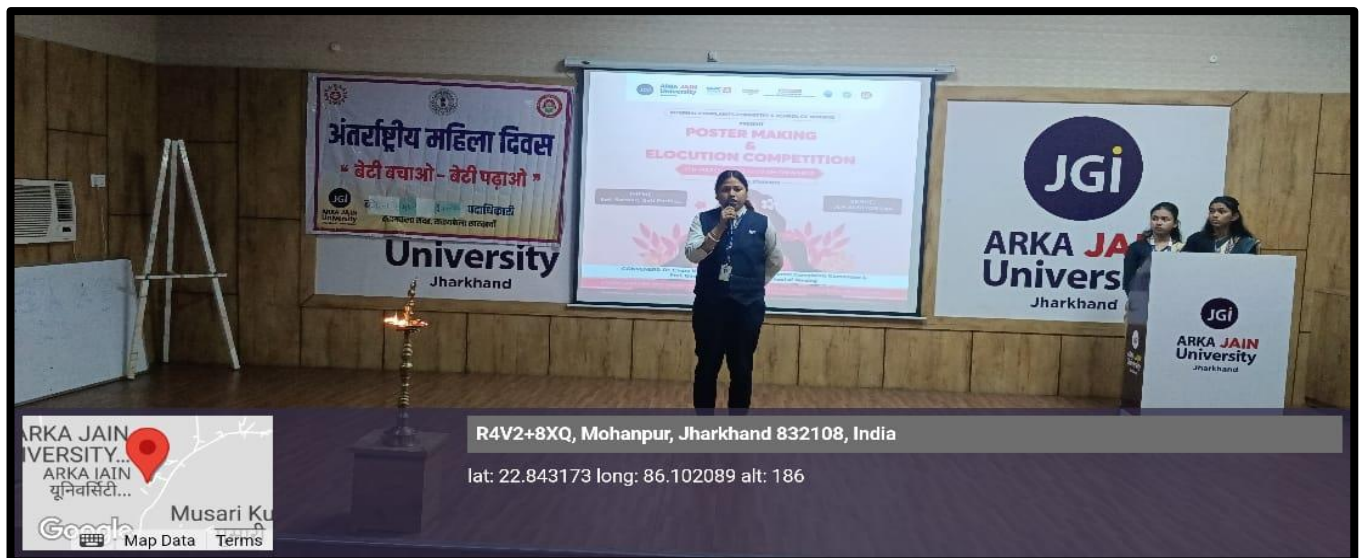
Figure 4: Participant of Elocution Competition delivering speech on Beti Bachao, Beti Padhao