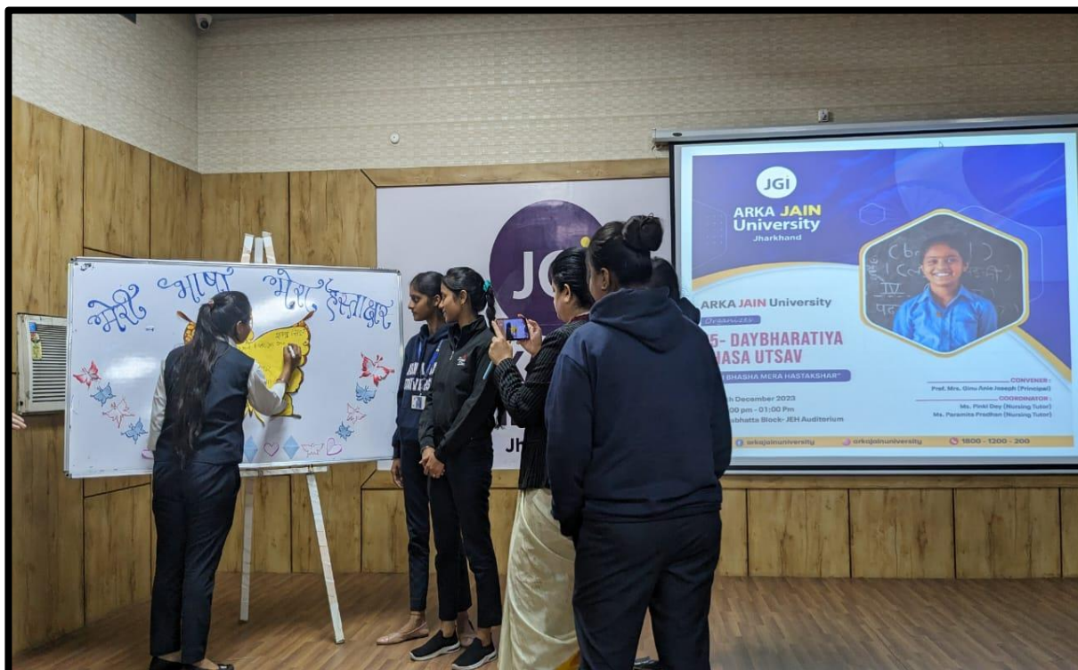
Figure 4: Students keeping on signature in their mother tongue