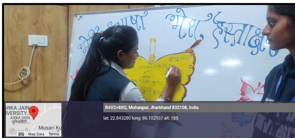
Figure 5: Students keeping on signature in their mother tongue