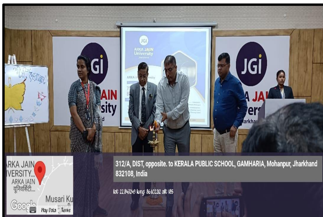
Figure 2: Lamp Light Ceremony