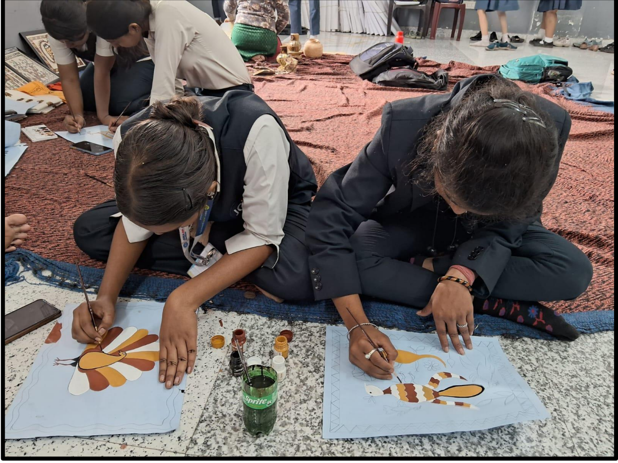
Figure 9: Students Working on Sohrai Painting