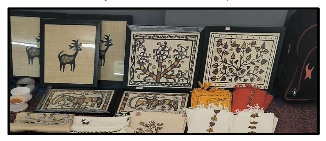
Figure 3: Exibition of Sohrai Painting