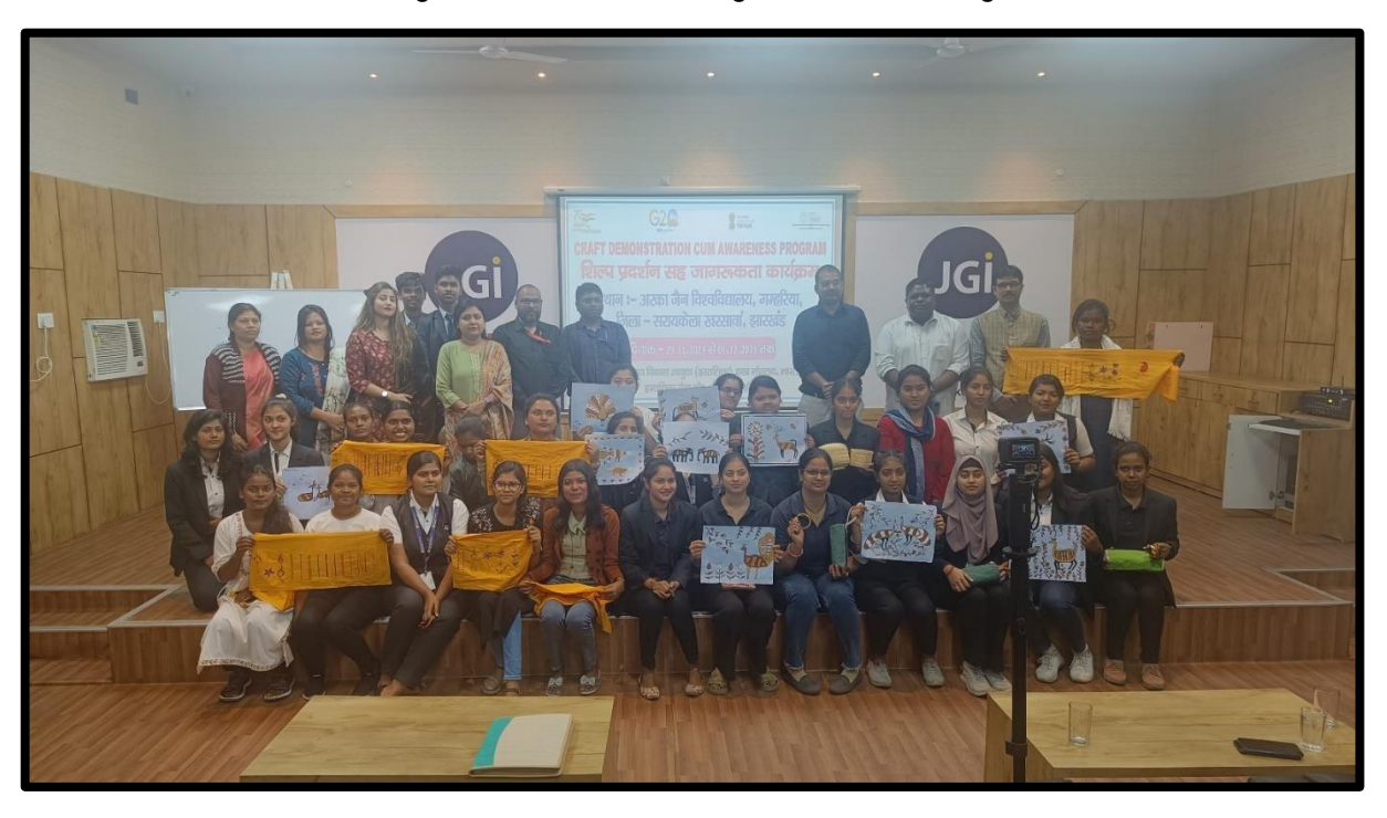
Figure 10: Conclusion of Workshop