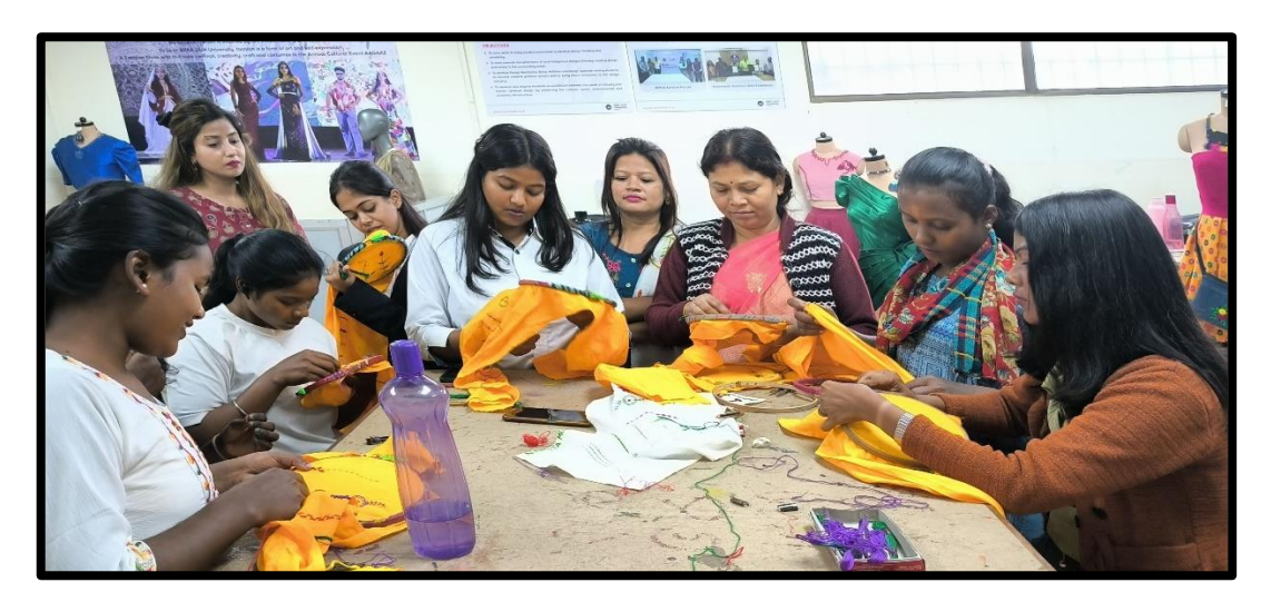
Figure 2: Demonstration of Embroidery