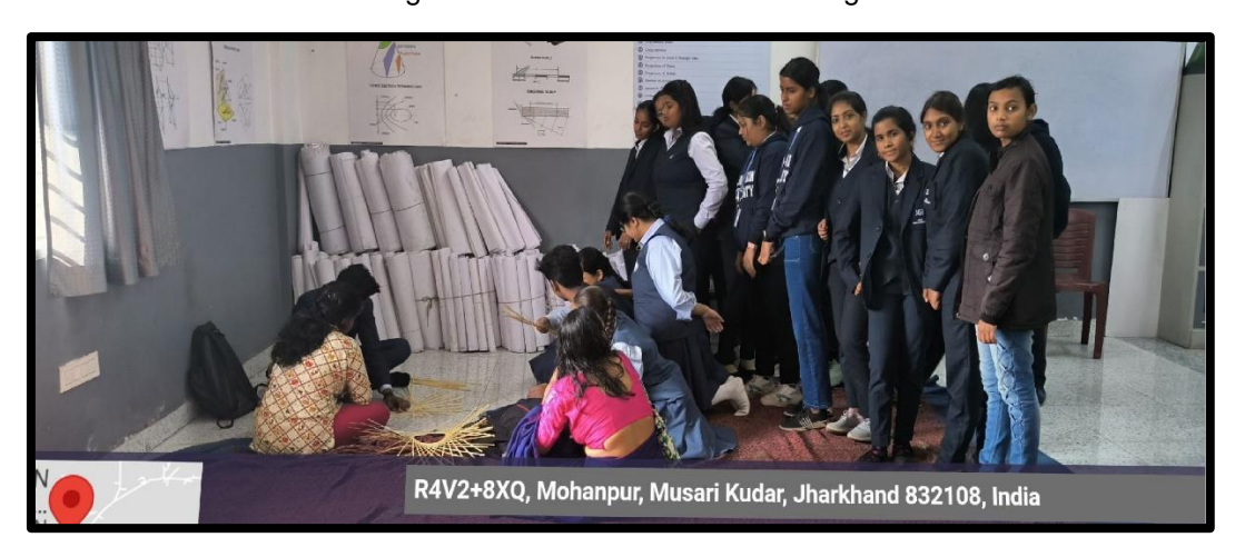
Figure 4 : Geo Tag Photo