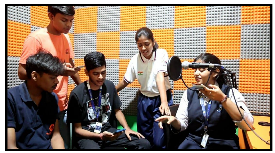
Figure 2: Students recording radio programme in Audio Lab on World Music Day