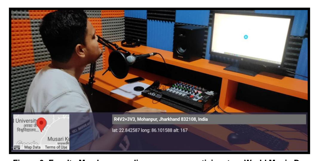
Figure 6: Faculty Member recording song as a participant on World Music Day