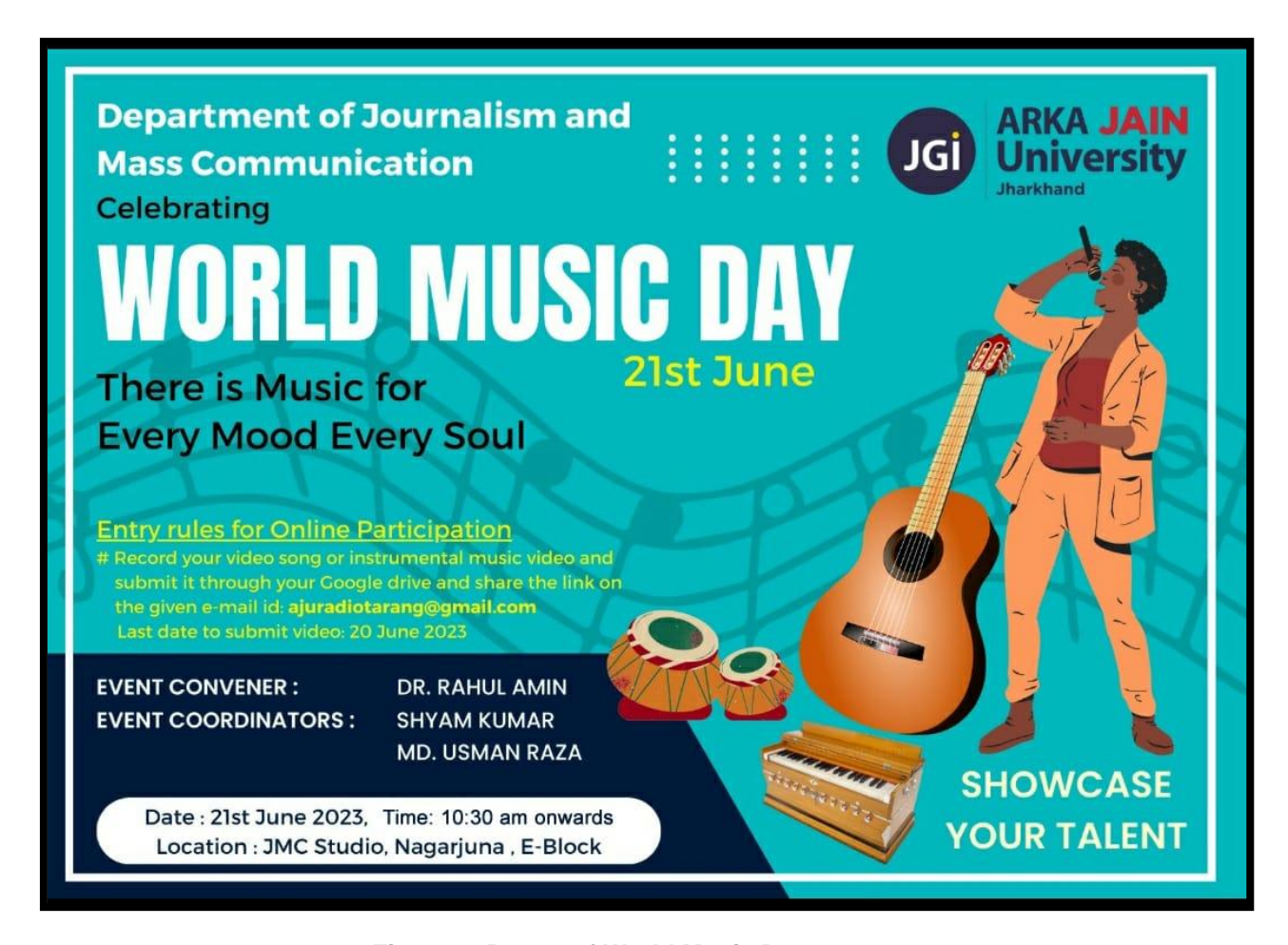
Figure 1: Poster of World Music Day