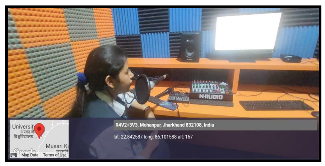
Figure 5: Student recording radio show as a Radio Jockey on World Music Day