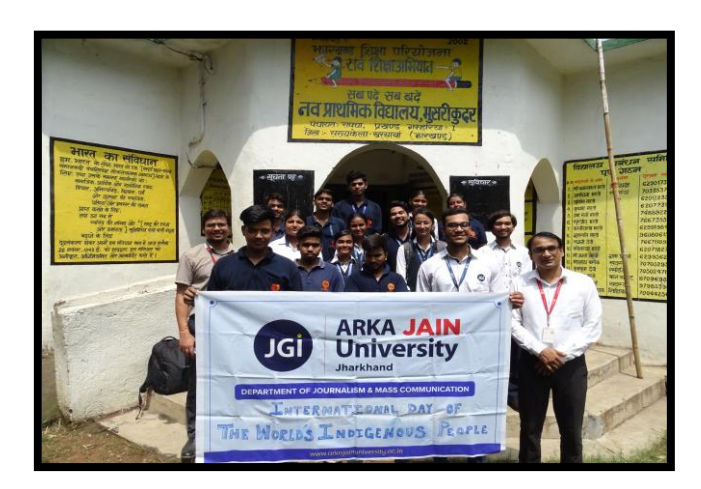
Figure 1: Students in a primary school at Musari Kudar Village on International Day of the World's Indigenous People