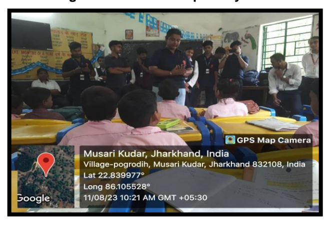
Figure 6: Students taking session on development at Musari Kudar Village