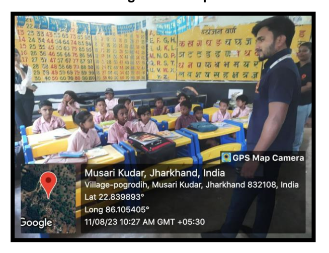
Figure 5: Students interacting with children in a primary school at Musari Kudar Village