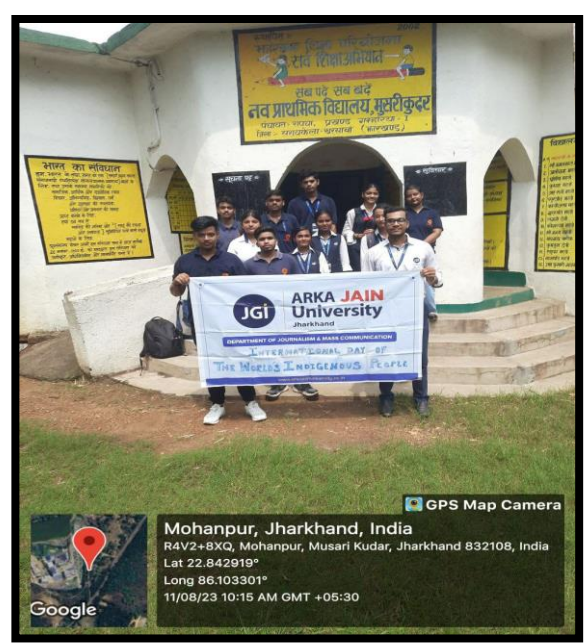
Figure 4: Students in a primary school at Musari Kudar Village on International Day of the World's Indigenous People