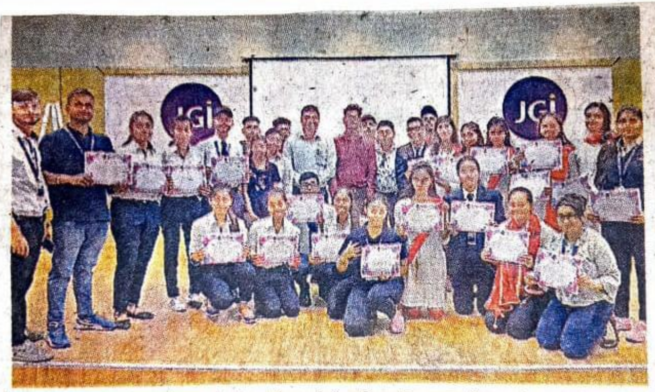
जागरूकता कार्यक्रम में भाग लेनी वाली अर्का जैन विश्वविद्यालय की छात्राएं जागरण