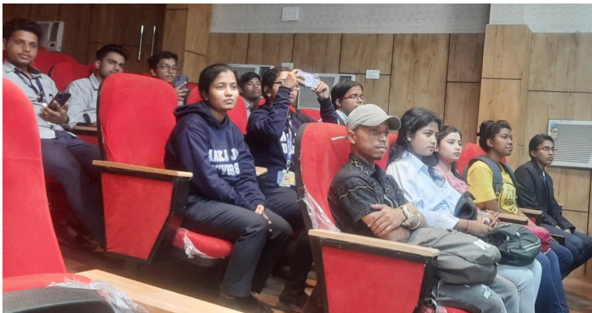
Fig. 1.5 Student audience of International Mother Language Day