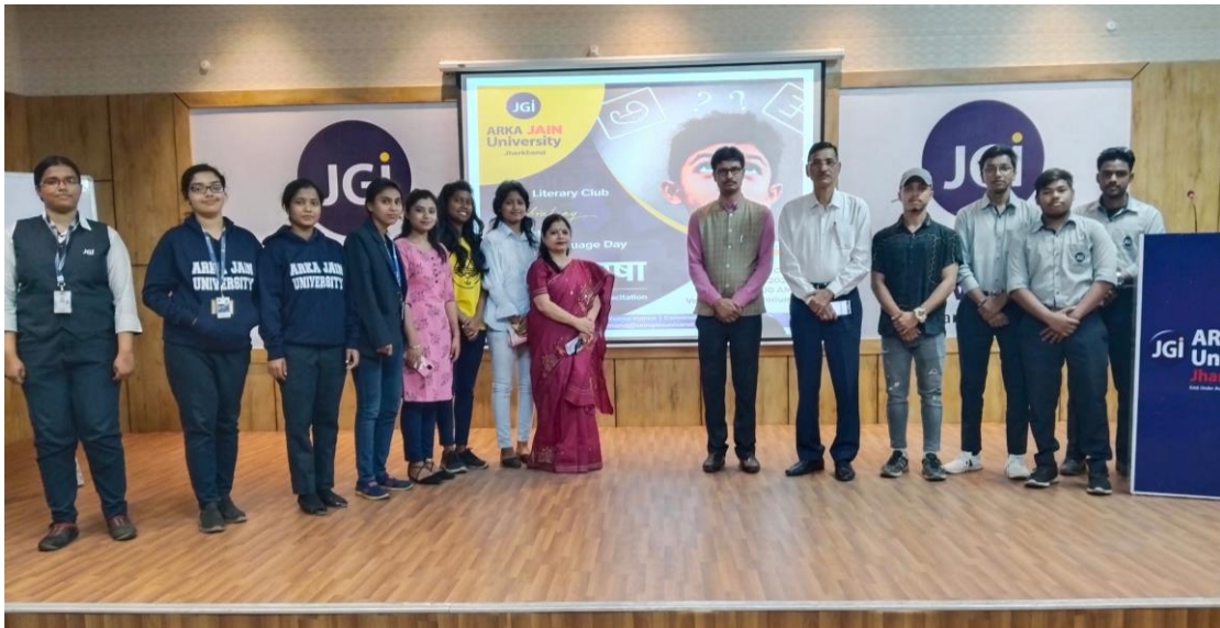
Fig. 1.1 Participants of Slogan, Speech, Poetry Recitation in International Mother Language Day